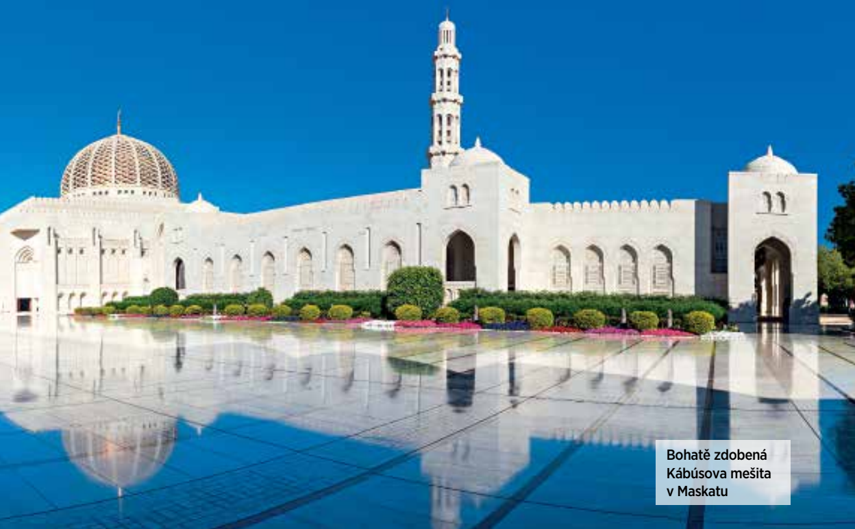
Bohatě zdobená Kábúsova mešita v Maskatu