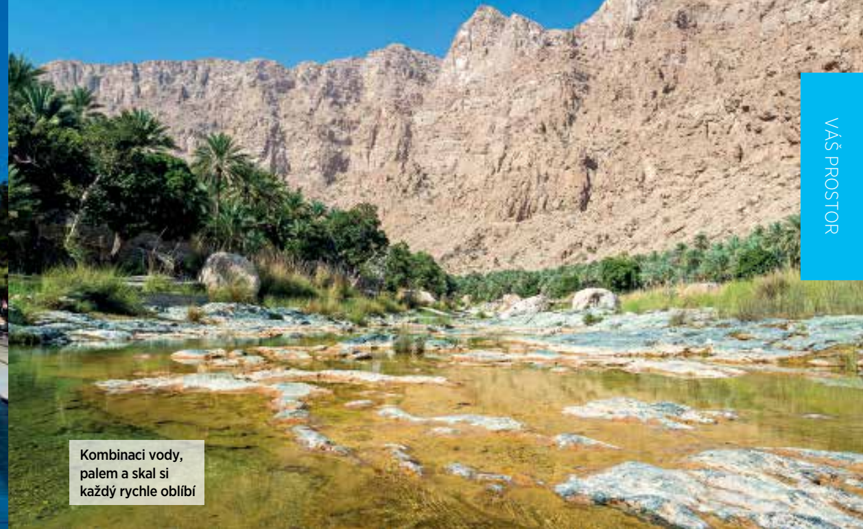
Kombinaci vody, palem a skal si každý rychle oblíbí