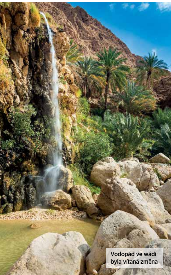
Vodopád ve wadí byla vítaná změna