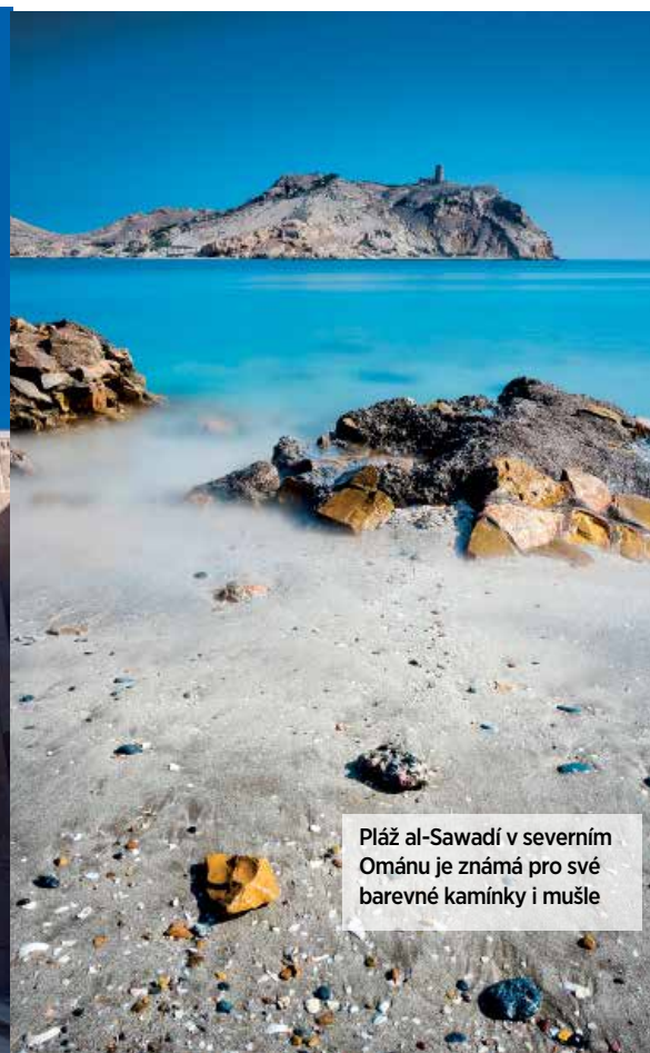
Pláž al-Sawadí v severním Ománu je známá pro své barevné kamínky i mušle